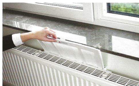
Att byta filter är enkelt eftersom filtret är böjbart

(*) På äldre Easy-Vent modeller har inte filterluckan någon låsfunktion, utan läggs bara på plats över filteröppningen.